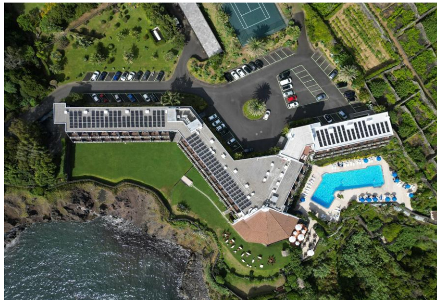
84.6kWp, Lagoa Açores.

A nossa equipa é especializada em identificar oportunidades e desenvolver planos de projeto alinhados com os objetivos dos clientes, assegurando a otimização de recursos e retornos financeiros. Comprometemo-nos com uma execução eficiente e comunicação clara, garantindo que os projetos cumprem os padrões exigidos no setor.