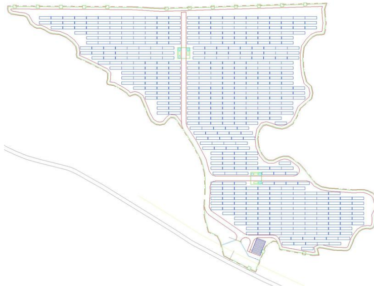
15MW PV project layout

Estabelecemos parcerias com os principais parceiros internacionais para oferecer um serviço local de qualidade, opções de financiamento personalizadas e planeamento de operação e manutenção aos nossos clientes, com o objetivo de garantir um desempenho consistente dos projetos, longevidade dos ativos e benefícios financeiros.