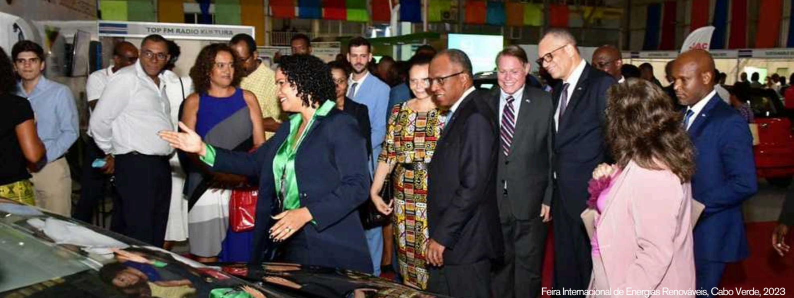
Feira Internacional de Energias Renováveis, Cabo Verde, 2023